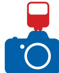
Фото- и видеосъемка

Преимущества специального налогового режима: